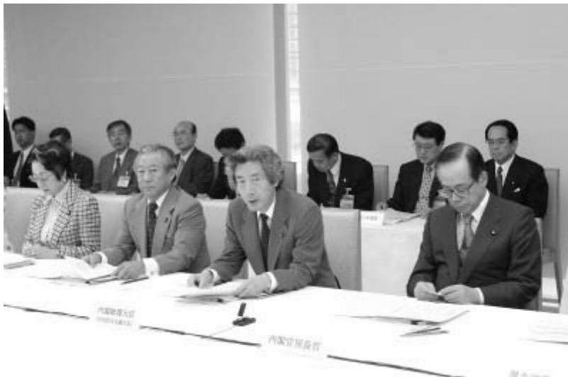
【右図：首相による警戒宣言発令（仮想） （写真は中央防災会議の様子）】

問26 あなたは地震に対する備えとして、この段階でどのようなことをする（したい）と思いますか。 東海地域の方も他の地域の方も東海地域でこのような事態が発生した場合を想定してお考えください。