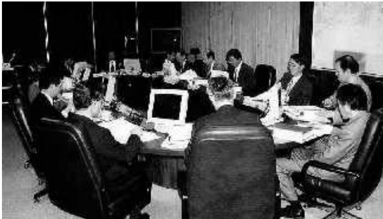
〔右図：東海地震の発生可能性を検討する「判定会」の様子（仮想）〕

問31 あなたは地震に対する備えとして、この段階でどのようなことをする（したい）と思いますか。東海地域の方も他の地域の方も東海地域でこのような事態が発生した場合を想定してお考えください。（○印はいくつでも）