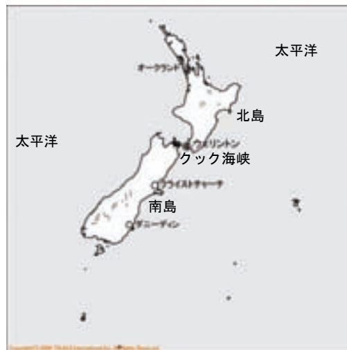
ニュージーランド