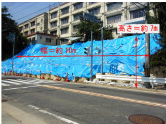
写真2.3.11 土砂崩れ現場の様子 (緑区鳴海町)