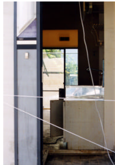
写真2.3.10 浸水した住宅内部 (天白区天白町野並)