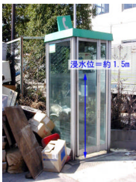
写真2.3.5 浸水した電話ボックス (西枇杷島小学校付近)