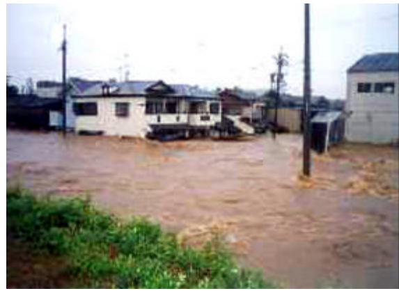
写真2.3.8 濁流に飲まれる天白区の家屋 10)