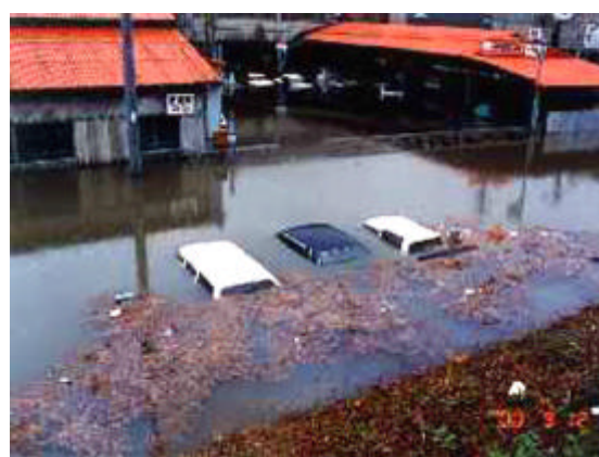
写真2.3.4 浸水した家屋と車 10)