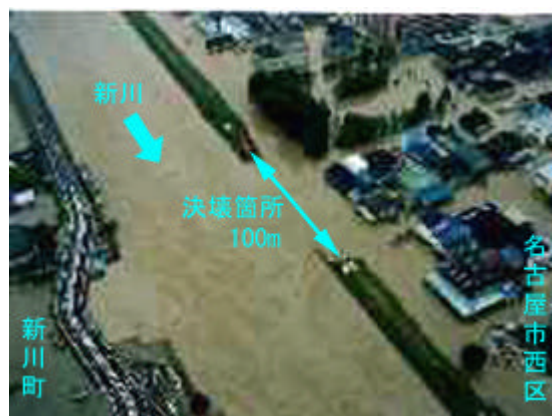
写真2.3.2 新川の破堤箇所(上空より) 10)