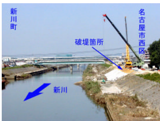
写真2.3.1 新川の破堤箇所(下流より)