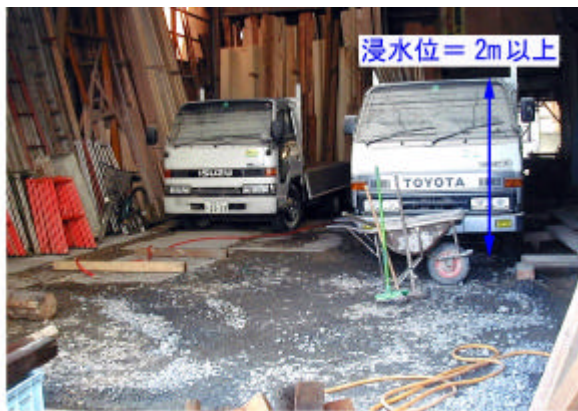
写真2.3.9 浸水した工場内部 (天白区天白町野並)