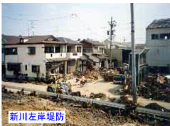
写真2.3.6 濁流により破損を受けた家屋 10) (新川左岸堤防付近)