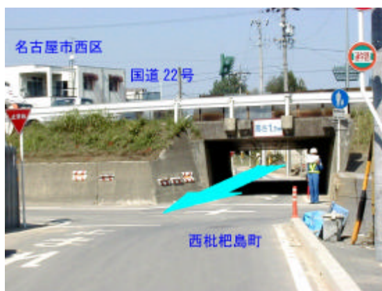
写真2.3.3 氾濫流の通り道