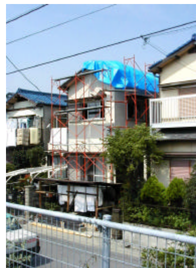
写真2.3.12 竜巻による屋根の破損 (緑区六田)