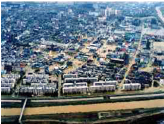
写真2.3.7 浸水した天白区の様子 10)